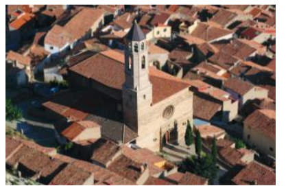
12 IGLESIA DE SAN MIGUEL