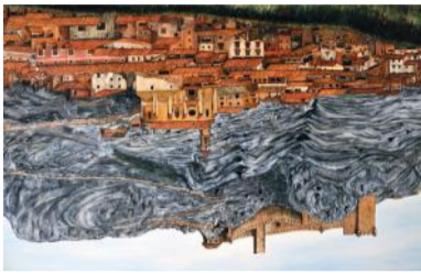
Reproducción de Castellote en 1820

Su espectacular y estratégico empla- zamiento en las faldas de la Atalaya, además de sus numerosos monu- mentos naturales y urbanos, hacen de este municipio un lugar de espe- cial importancia. Fue incendio con-