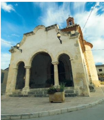
17 SAN MACARIO