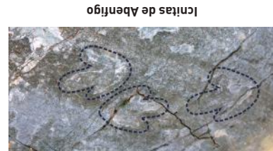
Ícnitas de Abenfigo

El término municipal de Castellote cuenta actualmente con dos barrios, Abenfigo y Las Planas de Castellote . Del primero destacan el origen islámico de su topó- nimo y la restaurada Iglesia Parroquial de San Julián, cuyos orígenes se remon- tan a 1546. Aunque sin duda, su mayor atractivo es el yaci- miento paleontoló-