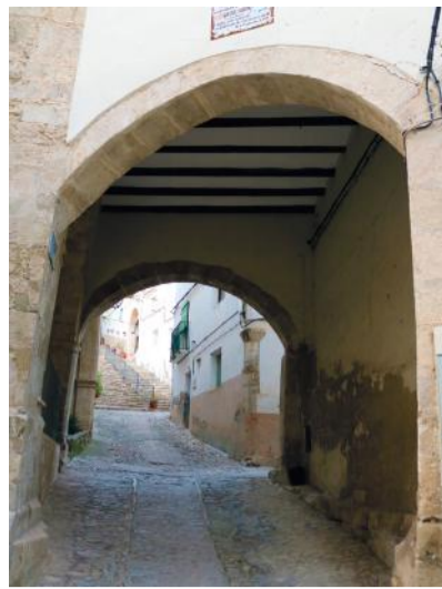
7 LAS CUATRO ESQUINAS