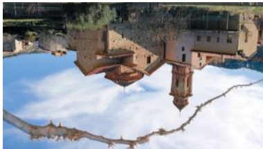
Dos Torres de Mercader

Tres son los municipios que a partir de 1970 pasan a formar parte de esta gran familia que es Castellote: Dos Torres de Mercader , Luco de Bórdón y Ladruña . Dos Torres de Bórdón destaca su localización elevada sobre un barranco. Su Plaza Mayor, de trazado irregular alberga el edificio del antiguo Ayuntamiento similar a la casa que consistió en la Edad Moderna. También es de es- ta dedicada a San Juan Bautista (siglo XVIII) de estilo entre el gótico-renacentista y el barroco, y su ermita dedicada a la Virgen del Pilar. En sus alrededores se encuentra el despoblado de Torremoncha y el núcleo urbano de Los Alagones con su espectacular formación geológica "El Morrón".