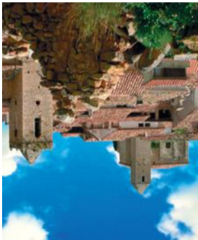
Luco de Bórdón