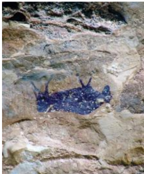
El Torico, Ladruña

ire levantino como los Abrigos del Pudal y la Vacada, o el Arenal de la Fonseca, declarados parte del Patrimonio Muni- dial en el marco de la declaración para el conjunto de Arte Rupestre Levantino de Arco Mediterráneo de la Península Ibérica, con restos arqueológicos de ocupación de todas las épocas.