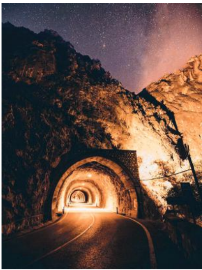
1 TÚNEL DE CASTELLOTE