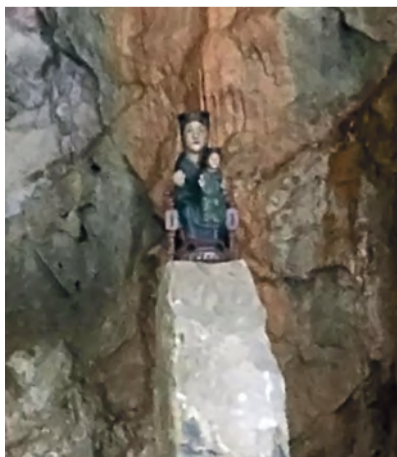
15 EL LLOVEDOR