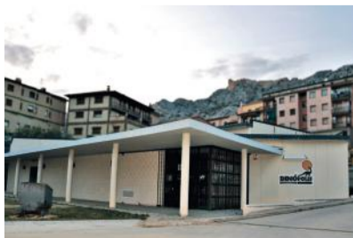
16 DINÓPOLIS "BOSQUE PÉTREO"